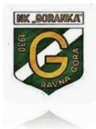
Slika 1. Grb NK „Goranka“