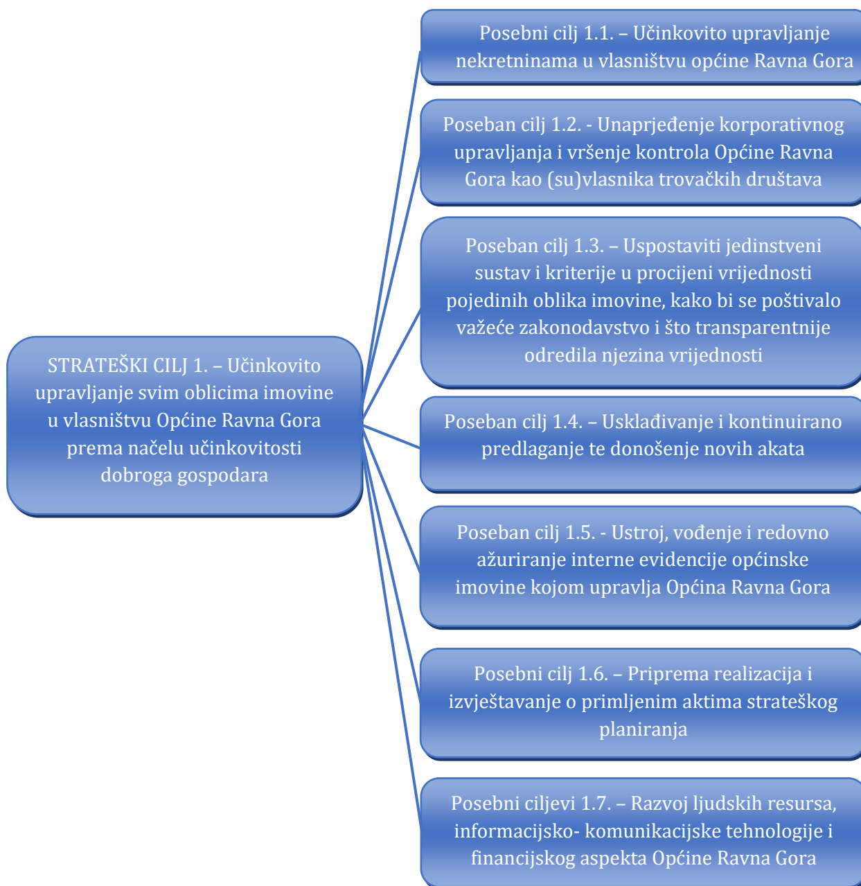
Slika 2. Kaskadiranje strateškog cilja upravljanja općinskom imovinom